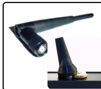
TNC eller NMO kontakt.